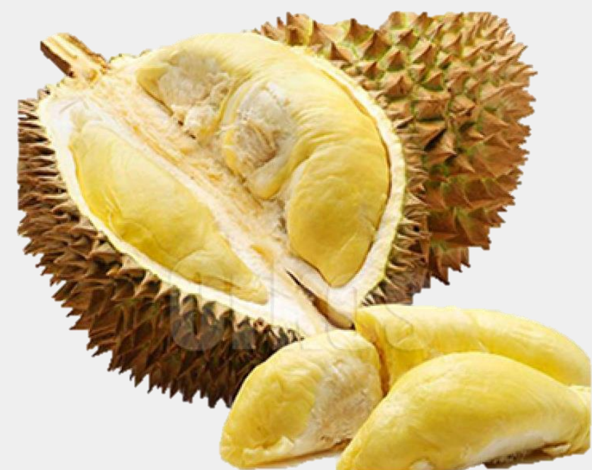
ทุเรียน : ร้อยละ และปริมาณการขายผลผลิตเป็นรายเดือน