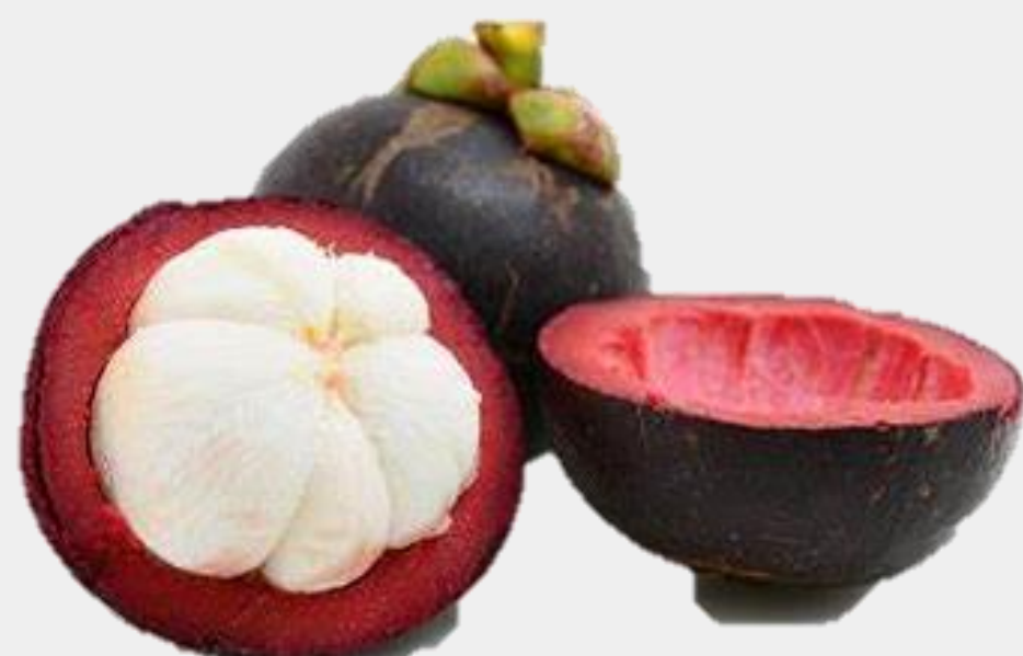
มังคุด : ร้อยละ และปริมาณการขายผลผลิตเป็นรายเดือน