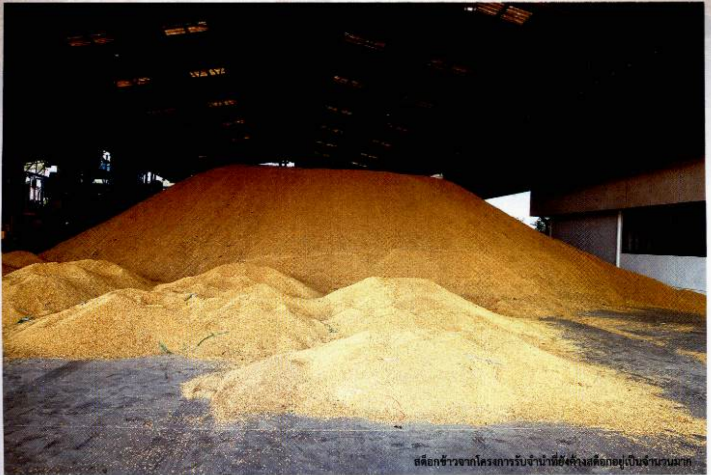
สต็อกข้าวจากโครงการรับจำนำที่ยังค้างสต็อกอยู่เป็นจำนวนมาก