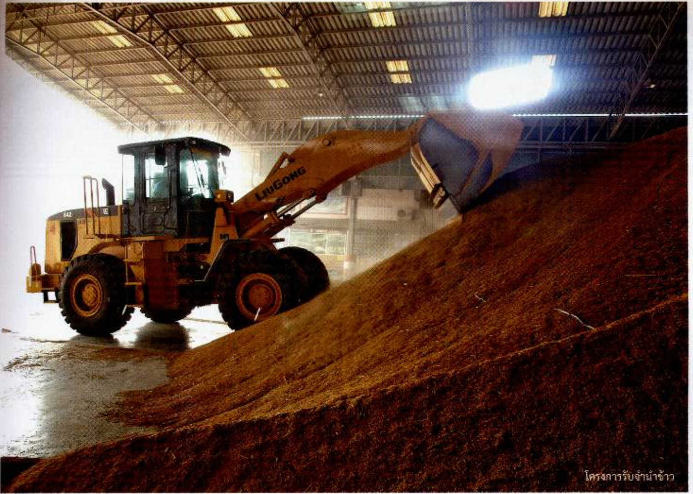
โครงการรับจำนำข้าว

เป็นนโยบายโดยประกาศรับจำนำข้าวเปลือกเจ้าทุกเมล็ดในระดับราคา 15,000 บาท และข้าวหอมมะลิที่ราคา 20,000 บาท ซึ่งถ้าหากใครติดตามก็จะได้รับทราบข้อมูลดังกล่าวมาแล้วน่าจะเป็นสาเหตุหนึ่ง เพราะการที่รัฐเป็นผู้ซื้อรายใหญ่ในตลาด ข้าวเปลือกที่เอกชนทั่วไปเคยรับซื้อในราคาตลาดทั่วไปไม่สามารถแข่งขันได้กับราคาที่รัฐรับซื้อ ข้าวเปลือกจำนวนมากจึงไหลเข้าไปสู่โครงการรับจำนำของรัฐ การรับจำนำในราคาสูงกว่าราคาตลาดของรัฐ แม้จะเป็นการตั้งราคาข้าวเปลือกในตลาดรับซื้อเอกชนให้สูงขึ้นตามราคาของรัฐ และทำให้เกษตรกรที่ขายข้าวทั้งที่ขายให้กับรัฐและที่ขายให้กับเอกชนจะได้รับราคาที่สูงขึ้นบ้างก็ตาม แต่ราคาข้าวเปลือกที่สูงขึ้นก็ได้สะท้อนไปยังราคาข้าวสารส่งออกและทำให้ราคาข้าวส่งออกของไทยปรับตัวสูงขึ้นตามไปด้วย