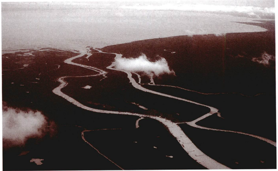
พื้นที่ปลูกข้าวเหนียวบริเวณที่ราบสูงและที่ราบตามหุบเขาของกลุ่มน้ำโขง

หลักฐานในอดีตพบว่าข้าวประจำถิ่นของภูมิภาคเอเชียตะวันออกเฉียงใต้ โดยเฉพาะในพื้นที่ราบสูงและพื้นที่ราบตามหุบเขาของกลุ่มประเทศอาเซียนที่ติดกับลุ่มน้ำโขง เป็นแหล่งของกลุ่มสายพันธุ์ข้าวเหนียวมาแต่ดึกดำบรรพ์ การค้นพบหลักฐานที่ถ้ำปู่ จังหวัดแม่ฮ่องสอน ก็พบว่าชนิดของข้าวที่ค้นพบเป็นชนิดของข้าวเหนียวไม่ใช่ข้าวเจ้า อีกทั้ง การพิสูจน์จากซากอัฐที่ทำขึ้นในสมัยโบราณพบว่ามนุษย์ใช้กลีบจากข้าวเมล็ดสั้น ซึ่งเป็นกลีบจากเมล็ดข้าวเหนียวนำมาเผาทำอัฐและใช้เป็นวัสดุสำหรับการก่อสร้าง การค้นพบหลักฐานในสมัยสุโขทัยเรื่อยมาได้บ่งบอกถึงการปรับเปลี่ยนจากการปลูกข้าวเหนียวมาปลูกข้าวเจ้ามากขึ้นเพราะในยุคสุโขทัย เรื่อย