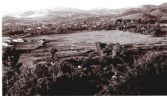
พื้นที่ปลูกข้าวเหนียวในสปป.ลาว

ไทย ลาว เขมร และเวียดนามจะมีประมาณ ผลผลิตข้าวเหนียวร้อยละ 12.58 ของ ผลผลิตข้าวรวม แม้พื้นที่ปลูกข้าวของสาธารณรัฐ ประชาชนลาวหรือประเทศลาวจะมีไม่