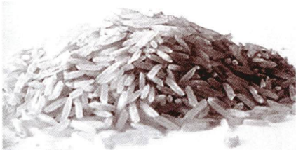
ข้าวอินดิกา

ข้าวเหนียวนางหูก ข้าวเหนียวกำใหญ่ ข้าวเหนียวกำน้อย ต่างก็มีสารเบต้าแคโรทีน ( \beta -carotene) ในระดับสูง เป็นต้น ซึ่งการมีสารอาหารด้านโภชนาการอย่างหลากหลาย จะมีส่วนสำคัญต่อการใช้เป็นวัตถุดิบในการผลิตผลิตภัณฑ์ที่เป็นอาหาร เสริมและอาหารที่เน้นด้านโภชนาการต่อสุขภาพได้อีกทางหนึ่ง ทั้งนี้ อาจจะอาศัยความก้าวหน้าทางด้านเทคโนโลยีชีวภาพมาใช้เป็นหลักในการปรับปรุงพันธุ์ที่มีคุณสมบัติด้านโภชนาการต่างๆ ตามมาอีกทางหนึ่ง